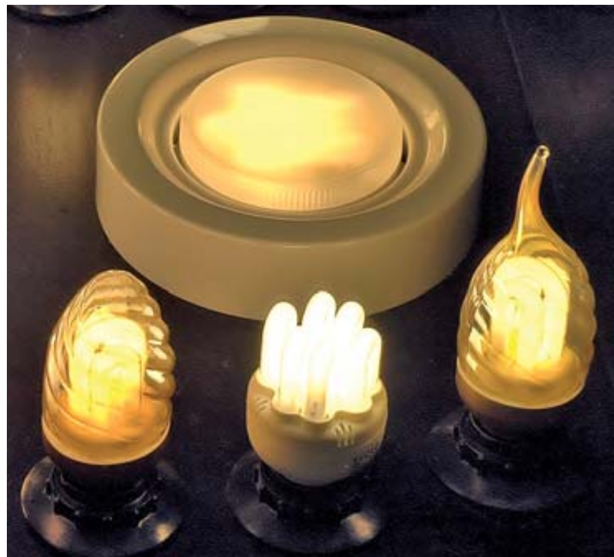
Энергосберегающие лампы, предлагаемые компанией «Теплый свет»