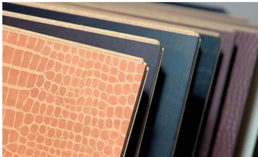
Образцы кожаных полов Tretford на стенде студии «Второе “Я”»

Еще одной частью помещения является потолок и прилегающие к нему угловые элементы. Они часто нуждаются в доводке — ведь простой белый свод комнаты может легко нивелировать необычный пол или нестандартную обработку стен. На отечественном рынке отделочных материалов уже более 16 лет существует компания DecoMaster (г. Химки, Московская обл.), специализирующаяся на выпуске клеевых потолков,