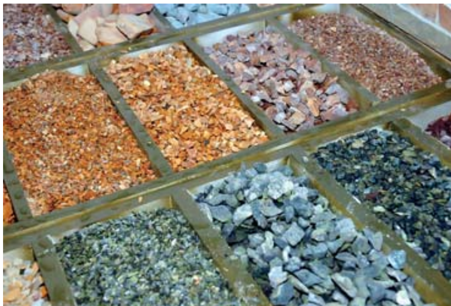
Продукция ООО «Камень Тенгри»

котором делают гальку и осуществляют галтовку* плитняков для облицовки.