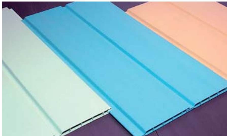
Экструдированные панели Panelit Lyon с невидимыми на лицевой стороне ребрами жесткости

Как известно, существуют два способа отделки откоса: оштукатуривание и дальнейшая покраска или закрытие боковых стенок оконного проема специально подобранным пластиковым материалом (по желанию — с дополнительным утеплением минеральной ватой). Для второго случая как раз и предназначена система Panelit, являющаяся, по сути, строительным конструктором. В зависимости от ширины откоса и угла между ним и плоскостью окна подбирается несколько профилей. Один крепится к откосу с помощью монтажного клея (типа «жидкий гвоздь»), после чего между ним и рамой вставляется панель и защелкивается вторым профилем. При необходимости систему можно разо-