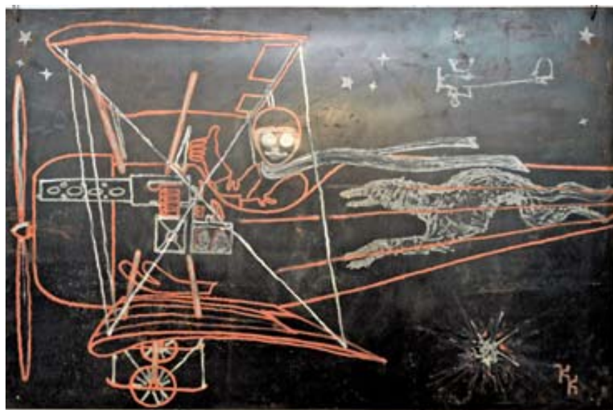
Образец росписи металлом, представленный ООО «Софис»

ский. Первый является признаком утонченного вкуса хозяина квартиры и характеризуется лаконичностью деталей и отсутствием лишних вещей. Второй тип подразумевает неожиданные или экстравагантные решения, будоражащие воображение. Однако мода очень переменчива, поэтому вполне возможно, что популярной такая обстановка будет не очень долго. Особо же надежен третий вариант — классика всегда красива, благородна и актуальна. Авторский интерьер в подобном стиле подходит для детей, молодежи и взрослых, он никогда не вызовет раздражения или недоумения.